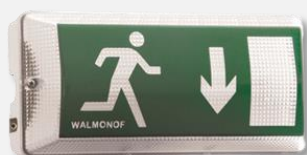
ADESIVO MERAMENTE ILUSTRATIVO