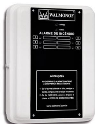
CMA-6 12V ou 24V